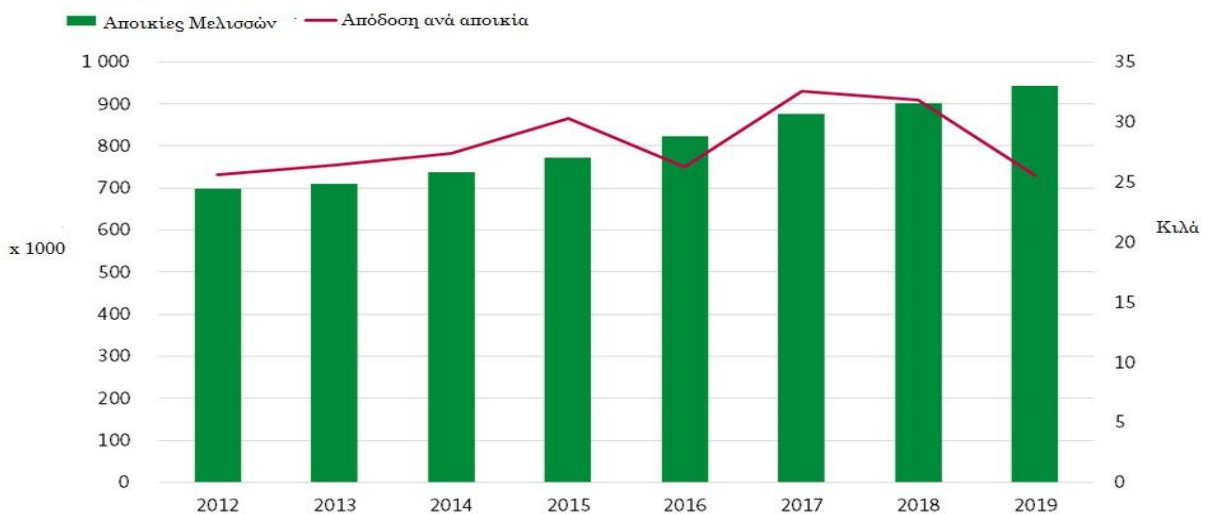
Γράφημα 2: Αποικίες μελισσών στη Γερμανία και απόδοση ανά αποικία

Αναφορικά με τις προδιαγραφές κυκλοφορίας μελιού στην αγορά της Γερμανίας, είτε πρόκειται για εγχώρια παραγωγή, είτε για εισαγόμενα προϊόντα, η τελευταία έχει εναρμονιστεί πλήρως με το ευρωπαϊκό θεσμικό πλαίσιο, όπως αυτό αποτυπώνεται στην «Ευρωπαϊκή Οδηγία 2001/110/ΕΚ του Συμβουλίου της 20ης Δεκεμβρίου 2001 για το Μέλι», εκδίδοντας μίας σειρά διαταγμάτων και νόμων.